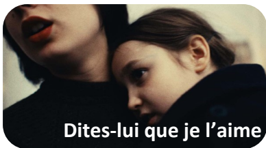
Dites-lui que je l'aime