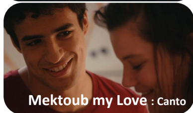
Mektoub my Love : Canto